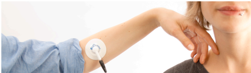
Abbildung 1: Performance Skintimacy

“historically [...] tactus was understood early on in the sense of intimacy, since [...] it essentially precludes a collective experience.” [Be02]