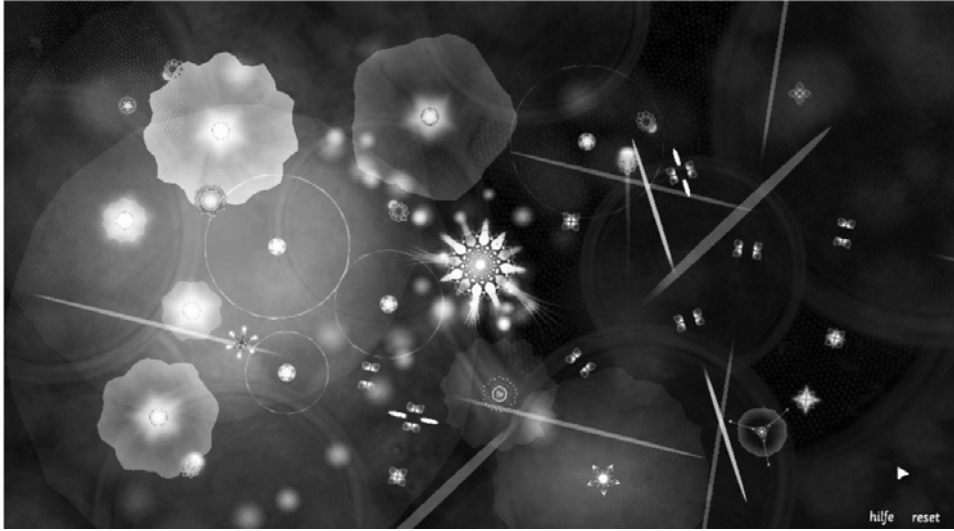
Abbildung 1: Screenshot